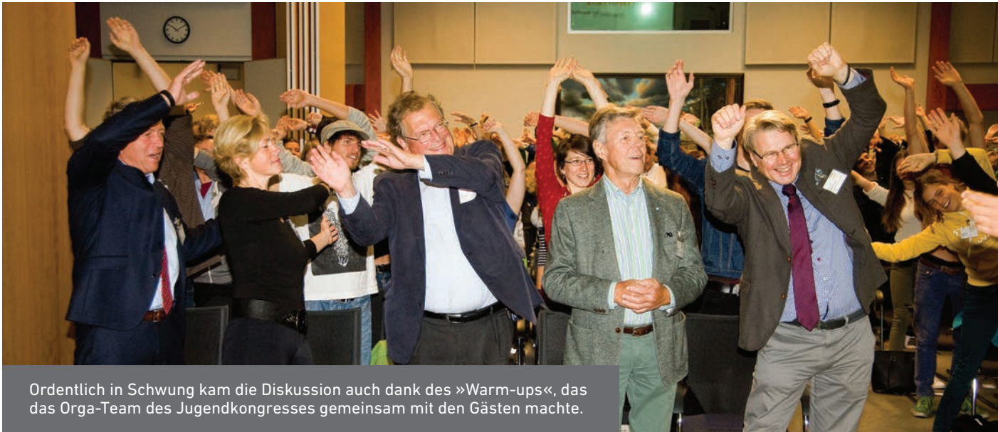
Ordentlich in Schwung kam die Diskussion auch dank des »Warm-ups«, das das Orga-Team des Jugendkongresses gemeinsam mit den Gästen machte.