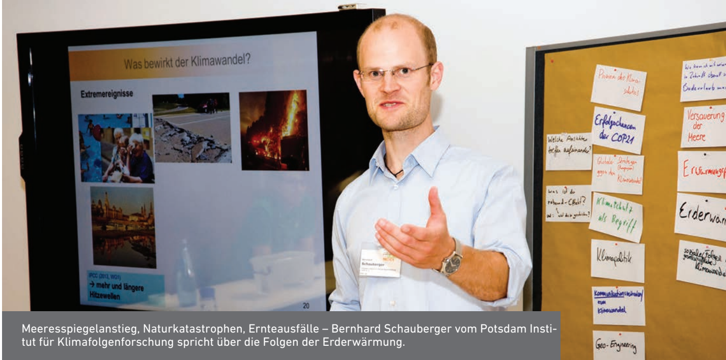
Meeresspiegelanstieg, Naturkatastrophen, Ernteausfälle – Bernhard Schaubberger vom Potsdam Institut für Klimafolgenforschung spricht über die Folgen der Erderwärmung.

häufen sich Katastrophen wie Waldbrände, Wirbelstürme und damit auch Ernteausfälle. Wenn der Kühlschrank der Welt zu einer Heizung wird, spricht man vom Eis-Albedo-Effekt, der das Schmelzen der Polkappen schwerwiegend fördert und langfristig Einfluss auf die Meeresströmungen ausüben kann.