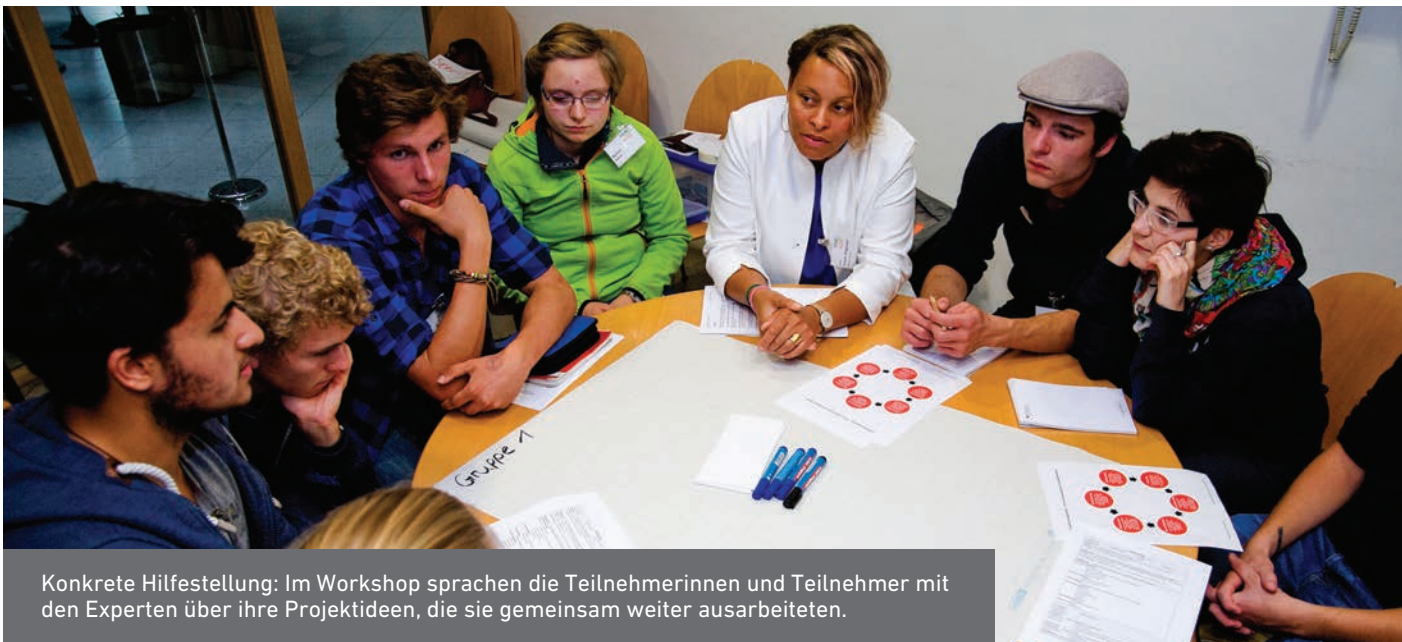
Konkrete Hilfestellung: Im Workshop sprachen die Teilnehmerinnen und Teilnehmer mit den Experten über ihre Projektideen, die sie gemeinsam weiter ausarbeiteten.