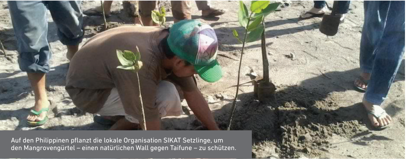
Auf den Philippinen pflanzt die lokale Organisation SIKAT Setzlinge, um den Mangrovgürtel – einen natürlichen Wall gegen Taifune – zu schützen.