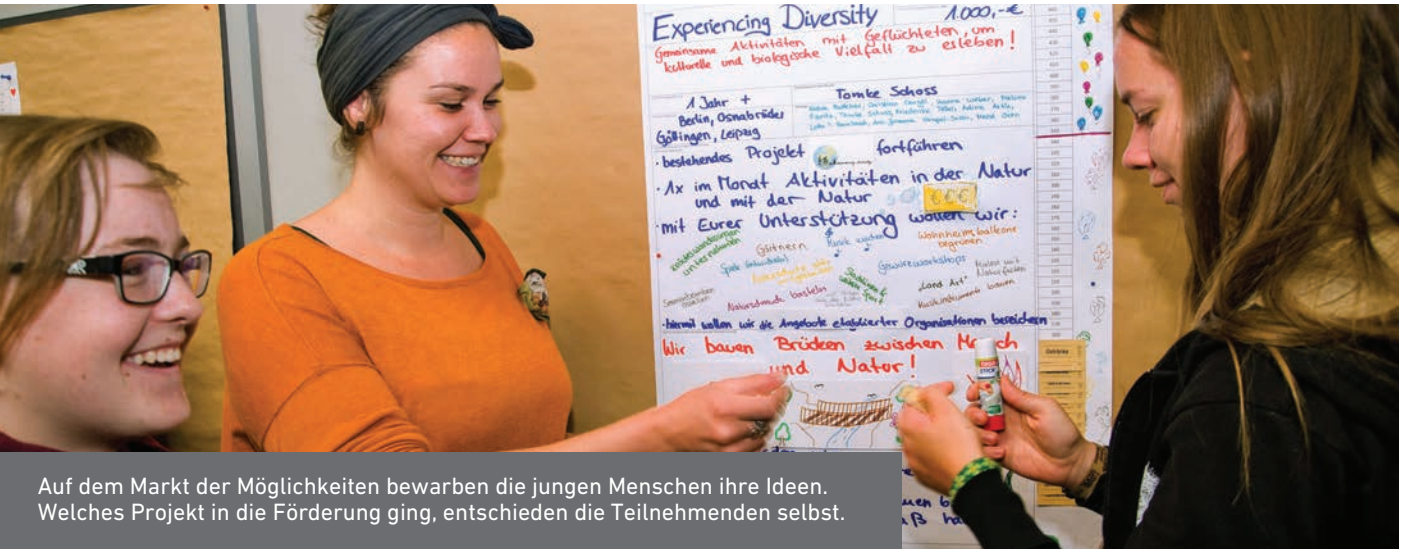
Auf dem Markt der Möglichkeiten bewarben die jungen Menschen ihre Ideen. Welches Projekt in die Förderung ging, entschieden die Teilnehmenden selbst.